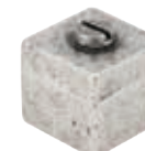
Ручка кнопка 358-16 состаренное серебро арт. 82858