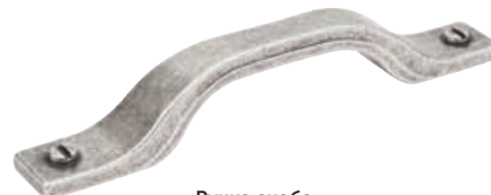
Ручка скоба 078-16-128/160 состаренное серебро арт. 82855