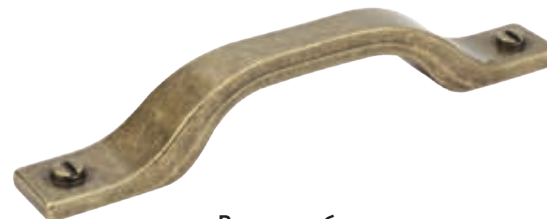
Ручка скоба 078-12-128/160 античная бронза арт. 82854