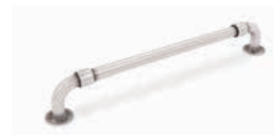
Ручка рейлинг 010-38-224 античное железо арт. 94247