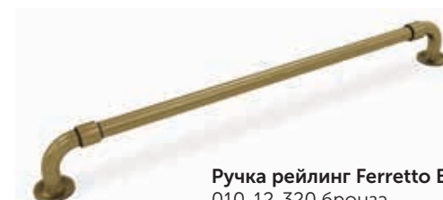
Ручка рейлинг Ferretto BU 010-12-320 бронза арт. 94245