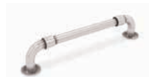
Ручка рейлинг 010-38-160 античное железо арт. 94246