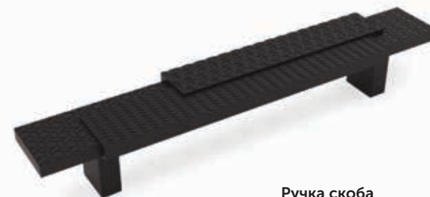
Ручка скоба 089-09-128 черный матовый арт. 94241