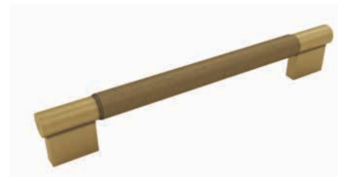
Ручка скоба Ferretto Triumph 083-04-160/192 бронза арт. 94237