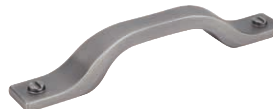
Ручка скоба 078-33-128/160 титан арт. 82853