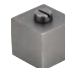
Ручка кнопка 358-33 титан арт. 82856