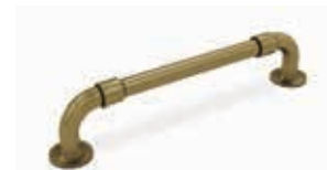
Ручка рейлинг Ferretto BU 010-12-160 бронза арт. 94243