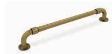
Ручка рейлинг Ferretto BU 010-12-224 бронза арт. 94244