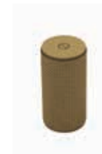
Ручка кнопка Ferretto Queen 386-04 бронза арт. 94238