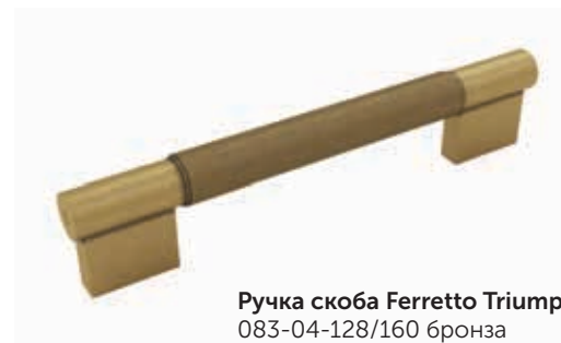
Ручка скоба Ferretto Triumph 083-04-128/160 бронза арт. 94236