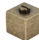
Ручка кнопка 358-12 античная бронза арт. 82857