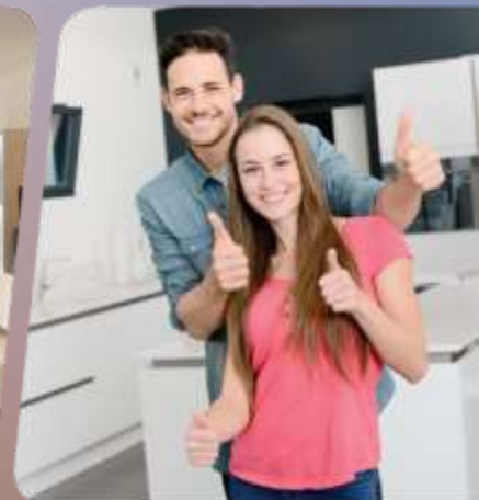
задоволення від результату