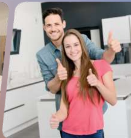
задоволення від результату

GIFF PRIME – петли для безупречной работы фасадов