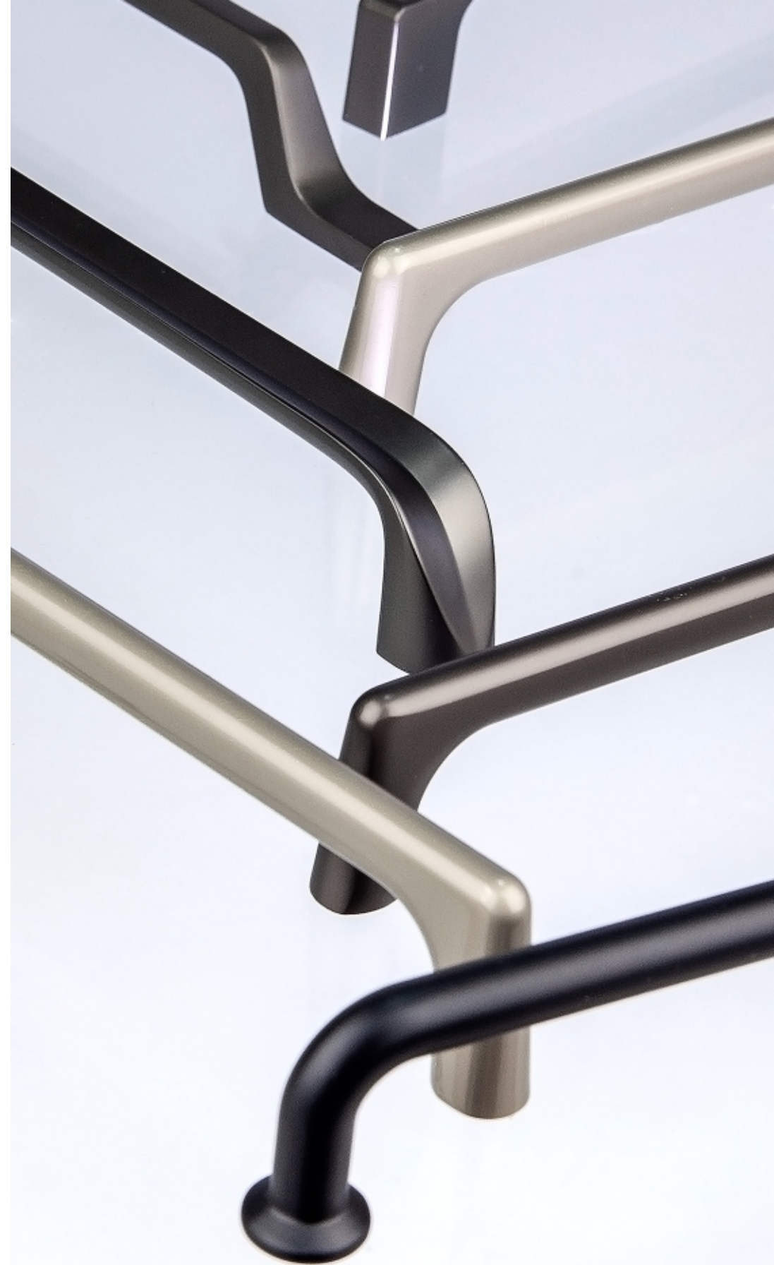
Сатин нікель арт: 106121, 128 \phi_{\text{мм}} арт: 106119, 96 \phi_{\text{мм}}